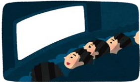
詳細はポスターにて

月に2回、分室で映画を上映しています。14時の時点で来ているメンバーさんで何を上映するか相談して決めています。先月は『ターミネーター3』を上映しました。