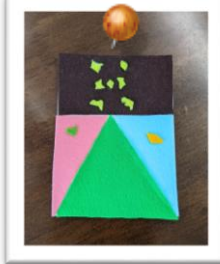
フェルトを使ったポストカード

5月の創作活動のテーマは『缶バッジ』の予定です。詳細はポスターにて。6日(金)30日(月)の予定です。